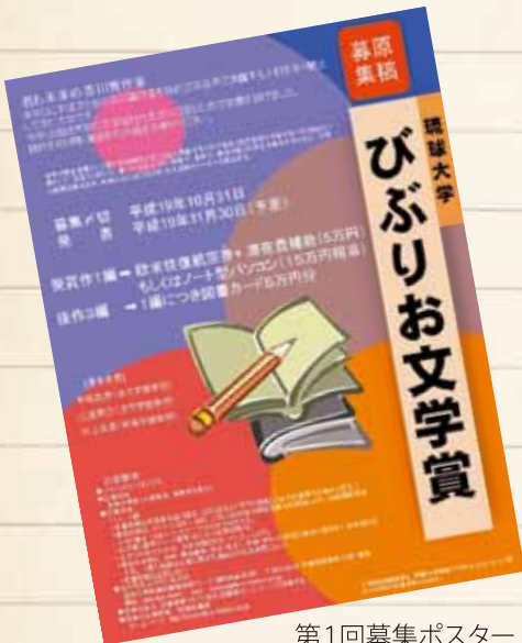
第1回募集ポスター

図書館は、文学賞を創設するという提案を受けてすぐに検討を開始したようで、翌2007年（平成19年）には第1回「琉球大学びぶりお文学賞」が創設された。図書館はこの文学賞創設の目的を次のように説明している——「『琉球大学びぶりお文学賞』は、琉球大学が基本目標として掲げる『地域及び広く社会に貢献する人材』『意欲と自己実現力を有する人材』育成の一環として、言語力（読む力、書く力）を向上させ、想像力、表現力、創造力豊かな学生を育成するとともに、文学の啓蒙活動を高め、地域社会における文学・文化活動のリーダーを輩出することを目的に琉球大学に在学する学生を対象に（中略）設けられました」。文学で大学と地域社会に貢献するという高い志を簡潔に説明する文章である。