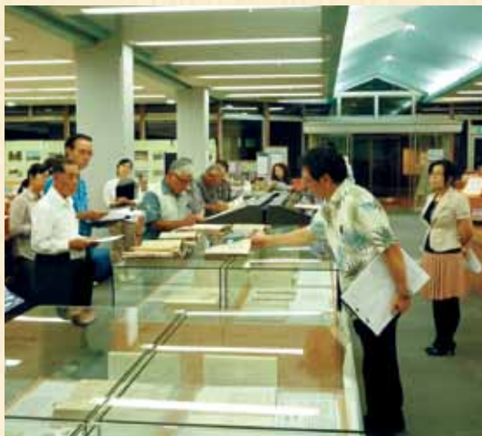
ギャラリートークの様子