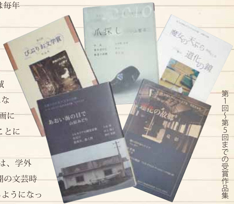
第1回〜第5回までの受賞作品集