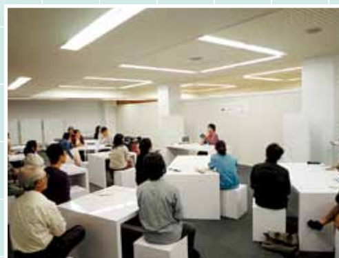
「ビブリオバトル in 琉大図書館」の様子

図書館内で不明になってしまった本を探す企画。キャンペーン中1冊、終了後5冊、計6冊の本がみつかりました。