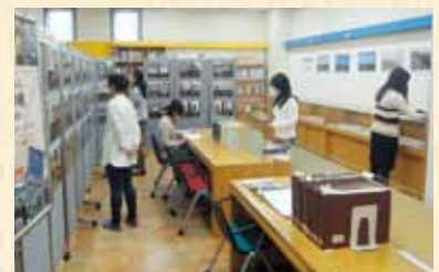
リバイバル展の様子